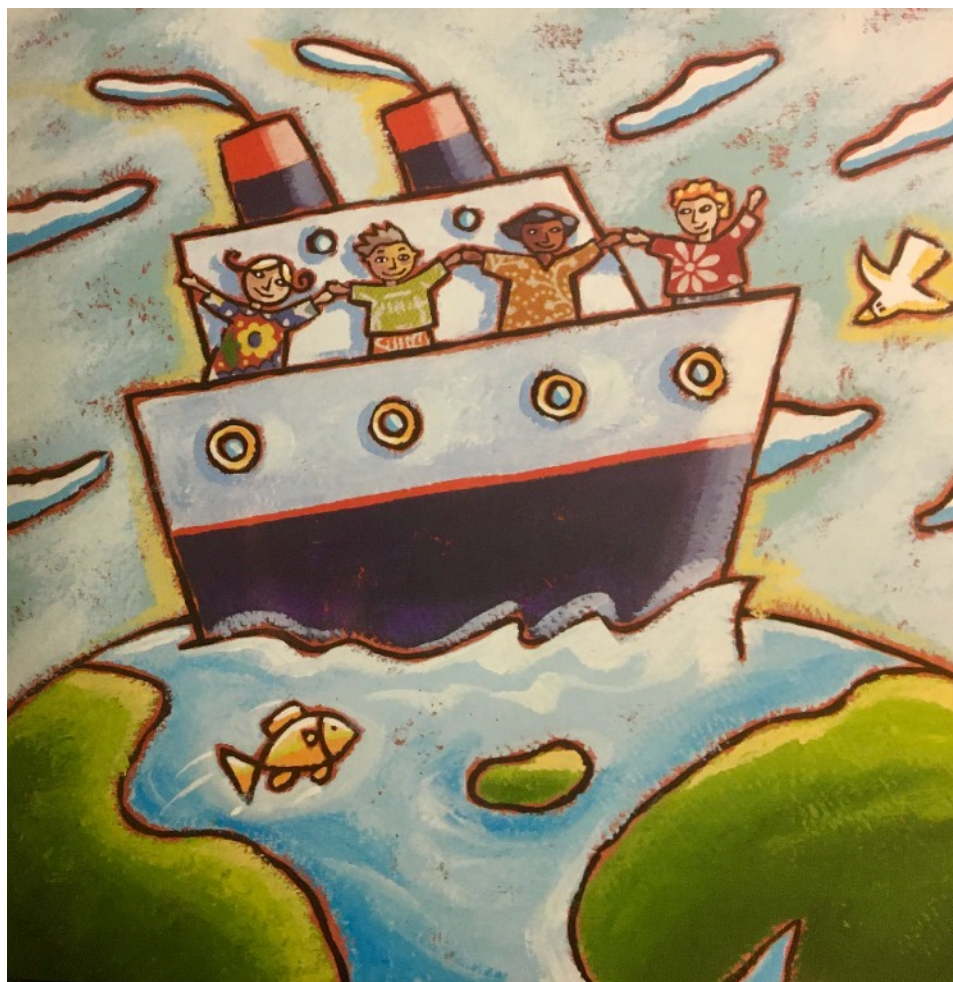
Illustration d'Arno dans Psaumes pour les tout-petits, éditions Bayard

On ne va pas toujours rester confinés, si on écoute Dieu, je crois qu'on sera comme sur cette image (montrer l'image qui suit), on montera de nouveau dans le bateau des autres. On en sera encore plus heureux qu'avant, on se dira : « Quelle chance de les voir en vrai ! »