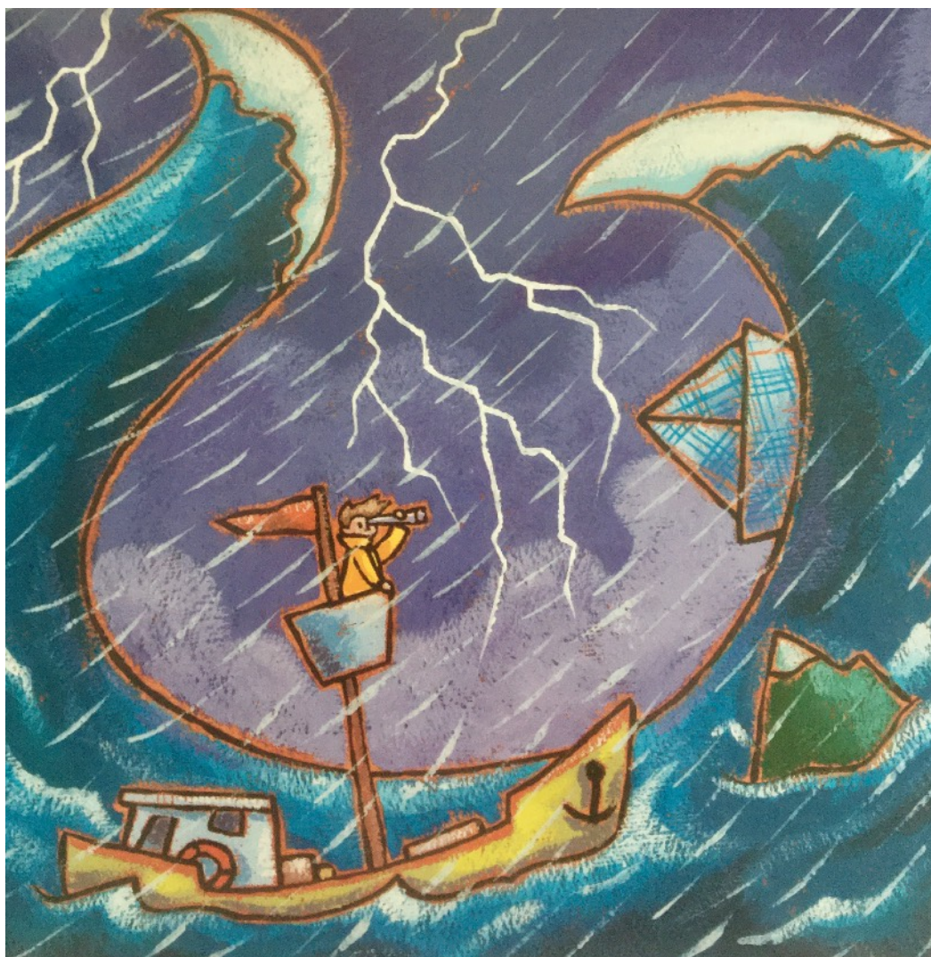
Illustration d'Arno dans Psaumes pour les tout-petits , Éditions Bayard

Laisser les enfants la décrire et faire leurs remarques.